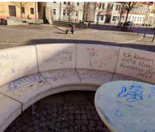
Wer Hinweise zu den Tätern geben kann, wendet sich bitte an die Polizei.