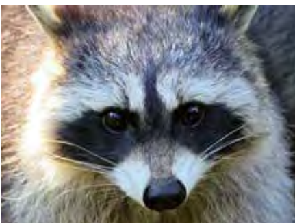
So niedrig sie aussehen, so viel Schaden können Waschbären anrichten.

Ein Hauptgrund für Konflikte zwischen Waschbären und Menschen ist die Suche nach Nahrung. Waschbären sind Allesfresser und können Mülltonnen durchwühlen