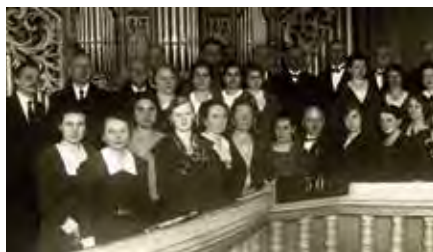
Der Kirchenchor zur 50-Jahr-Feier 1934.

Es erklingen Kantaten und Lieder rund um den Psalm 23 „Vom guten Hirten“ von Johann Sebastian und Carl Philipp Emanuel Bach, Wolfgang Amadeus Mozart u.a.