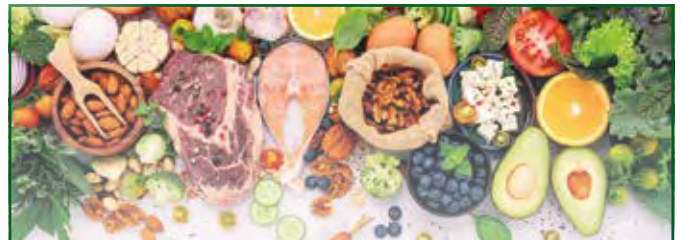
„Genuss & Kunsthandwerk“ Landkreis Leipzig

Sie suchen ein kulinarisches Präsent? Sie sind Liebhaber von Kunsthandwerk? Sie möchten wissen, wo Sie regionale Produkte im Landkreis Leipzig finden? Dann besuchen Sie das Produktportal des Landkreises Leipzig! Hier finden Sie untergliedert in die Kategorien „Genuss“ und „Kunsthandwerk“ zahlreiche Akteure mit Informationen zum Produkt-Repertoire und wo diese zu finden sind. Ebenso erhalten Sie eine Übersicht zu bestehenden Partnernetzwerken, die sich ebenso der Stärkung der regionalen Produktvielfalt widmen.