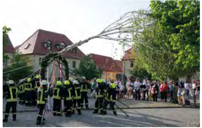
Gemeinsam wurde der Maibaum gesetzt.

Den „letzten Einsatz“ des Monats hatte die Freiwillige Feuerwehr mit dem Maibaumsetzen am 30. April.