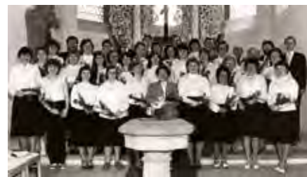
Der Chor zu 100-Jahr-Feier 1984.

An diesem Abend wird auf unterhaltsame Weise die Geschichte des Kirchenchores lebendig: die ersten Proben im „Hotel