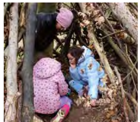
Bei der Osterwanderung konnten die Kinder die Natur zu erkunden.

Nun freuen wir uns alle auf die nächsten Highlights im Hort und vor allem unser großes Sommerfest am 30. Mai.