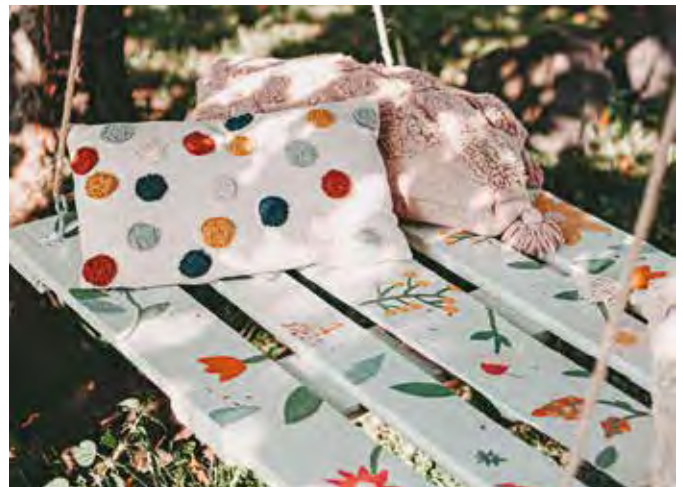
Die selbst gebaute Baumschaukel wird mit fröhlichen Farbtupfern schnell zum neuen Lieblingsplatz im Garten.

Für gute Resultate sollte die zu lackierende Oberfläche sauber und trocken sein, bei einem vorhandenen Altanstrich empfiehlt sich außerdem ein Anschleifen. Der vielseitige Weißlack hat viele Qualitätseigenschaften der beliebten Wandfarbe übernommen, zum Beispiel die sehr hohe Deckkraft und den gleichmäßigen Verlauf für glatte Oberflächen. Der