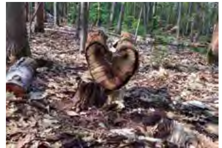
Das Kita-Team stärkte bei einer Schnipseljagd auf dem Kohlenberg den Zusammenhalt.

Mit dieser tollen Erinnerung und einem gestärkten Wir-Gefühl startet das Team zu-