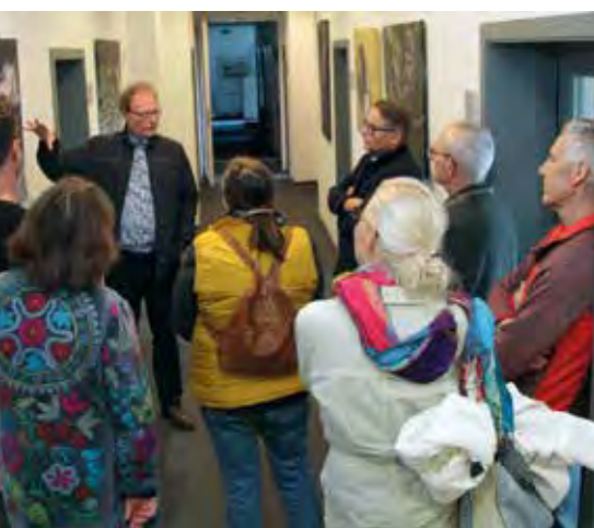
Jedes Bild hat seine Geschichte und benötigt vor allem Geduld des Fotografen.

Ausstellungen haben im Brandiser Rathaus eine lange Tradition. Ob regionale Künstler, Schüler oder auch die Feuerwehr – hier gab es verschiedenste Anlässe. Mit Corona nahmen die Schauen ein jähes Ende.