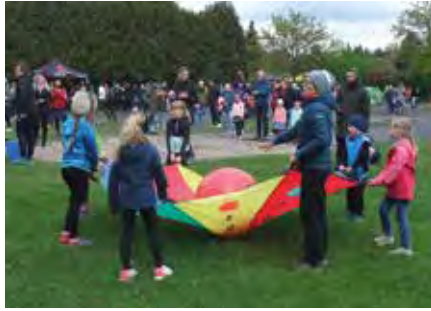
Startvorbereitungen zum Countdown.

Zu diesem Zeitpunkt war an eine Verlegung nicht mehr zu denken. 150 Teilnehmermedaillen für die Kinder und Jugendlichen, 200 schicke Jubiläumsurkunden. Sollte das alles umsonst gewesen sein? Ab 15.00 Uhr waren die ersten Helfer vor Ort und begannen damit, das Wasser aus der Laufbahn zu kehren. Es hatte tatsächlich aufgehört zu regnen. Die Wetter-App prophezeite eine Regenspauze von 3 Stunden. Das würde reichen. Inzwischen fand die Fotoausstellung zur 40-jährigen Geschichte des Stundenlaufes im Vorraum des Turnhallenbereichs bei den Besuchern des „Tags der offenen Tür“ der GS Beucha reges Interesse.