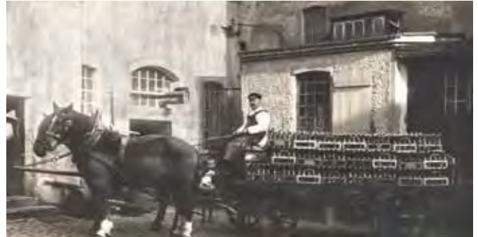
Bierausfuhr in Wurzen, 1. Hälfte 20. Jh.