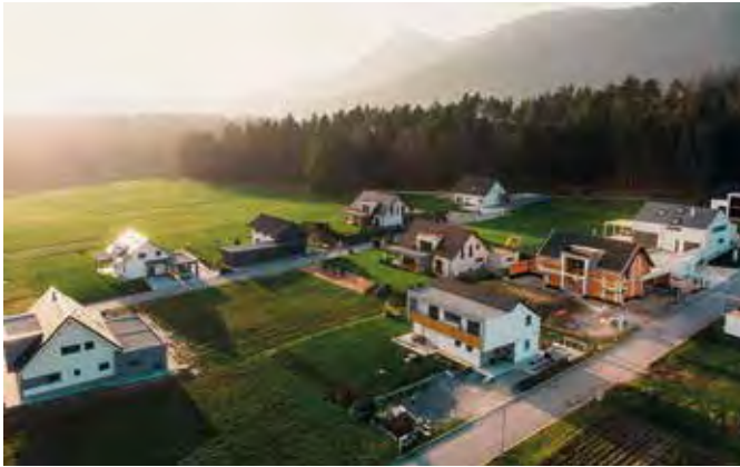
Ein Baugrundgutachten vor der Kaufentscheidung für ein Grundstück ist eine sinnvolle Investition, um unerwartete Überraschungen zu vermeiden.

Ein Baugrundgutachten gibt mehr Sicherheit für den Eigenheimbau