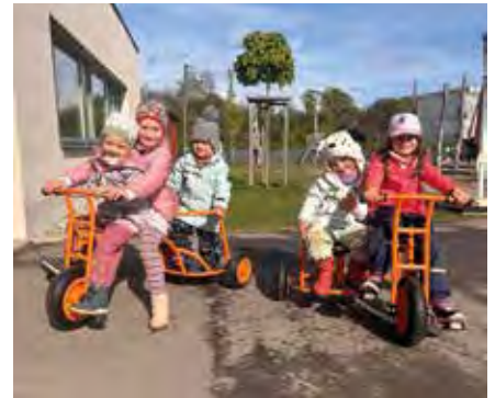
Mit den neuen Fahrzeugen hatten die Kinder eine Menge Spaß.

Seit Beginn des Jahres werden die Erzieher und Erzieherinnen der Kita Purzelbaum wieder von zwölf neu gewählten Eltern aktiv unterstützt. Als Elternrat organisieren wir Feste und Veranstaltungen, suchen den Dialog zwischen Eltern und Erziehern, bringen Ideen für den Kitaalltag ein und kümmern uns um die Belange unsere Kinder. Auch in diesem Jahr wollen wir wieder beim Parkfest und am Sommerfest teilnehmen. Solche Veranstaltungen können wir aber unmöglich allein stemmen. Wir benötigen dafür auch in