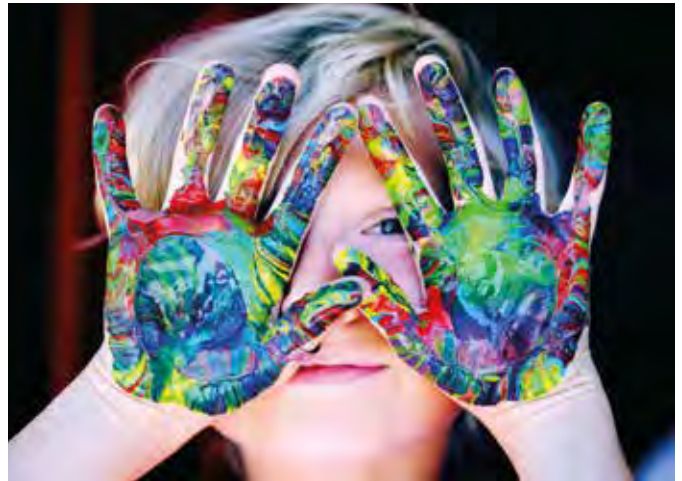
Kinderfotos im Netz verdienen Schutz.

passwortgeschützte Online-Ordner, die Sie via Link mit ausgewählten Personen teilen können.