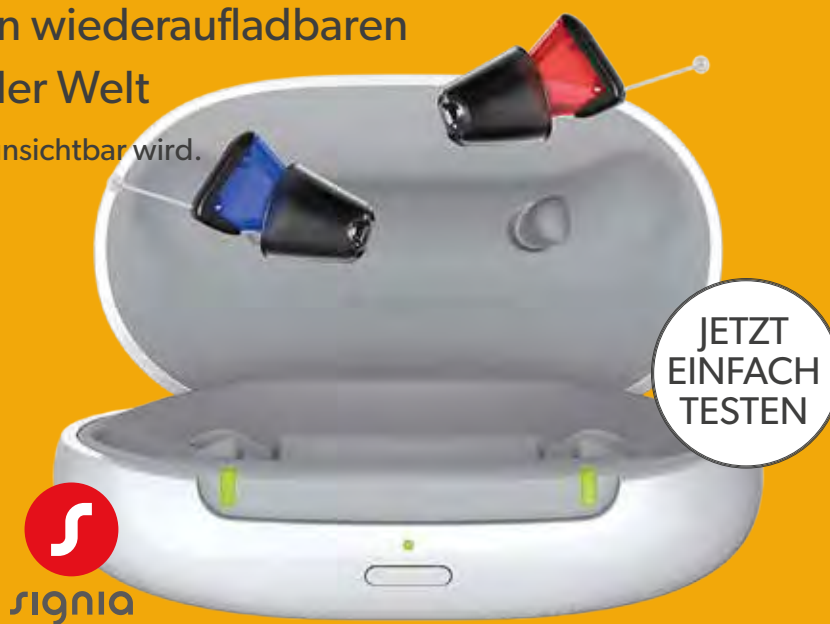
Silk Charge & Go IX

ZENTRALE WURZEN : JACOBSSGASSE 17 • TEL.: 03425/852286 FILIALE WURZEN : BADERGRABEN 12 • TEL.: 03425/8530414 FILIALE NAUNHOF : MARKT 5 • TEL.: 034293/558757 FILIALE GROITZSCH : BREITSTR./ECKE SCHULGASSE • TEL.: 034296/744640