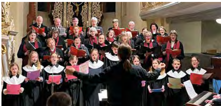
Der Chor zum Adventskonzert 2023.

Durch großformatige Fotos von 1900 bis heute entsteht ein Panorama der Chorgeschichte. Zu sehen sind dabei die vielen ehemaligen und jetzigen Sängerinnen und Sänger, aber auch Plakate und Programme aus den vergangenen Jahrzehnten.