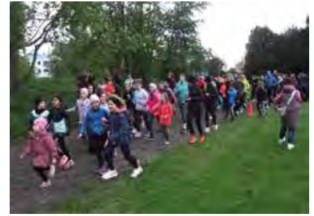
Über 220 Sportler hatten sich am Start eingefunden.

Viele treue Fans wären sicher auch bei schlechteren Bedingungen dabei gewesen. Nach einer zünftigen Erwärmung durch die Leichtathleten der mittleren Trainingsgruppe versammelten sich Kinder, Jugendliche und Erwachsene am Start. Diesmal sollte kein prominenter Sportler den Lauf eröffnen, sondern die Läufer waren aufgefordert, selbst das Startkommando zu geben. Bei „los“ schleuderten die jüngsten Leichtathleten des Vereins mit einem Schwungtuch einen großen roten Pezziball mit einer 65 in die Höhe und die Läufer­schar setzte sich in Bewegung. Am Ende waren es tatsächlich