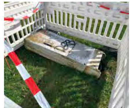
Auch wer hierzu Hinweise zu den mutmaßlichen Tätern geben kann, wendet sich bitte an die Polizei.