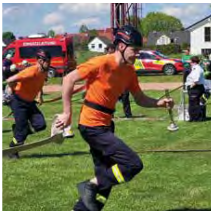
Pokallauf Feuerwehrsport am 27. April.

Mannschaften starteten die Sportler in Brandis zum Pokallauf. Unsere erste Mannschaft bestand ausschließlich aus Ü30-Kräften und hat sich den Sieg geholt! Für unsere zweite Mannschaft (U30) hat es leider nur für den 6. Platz gereicht. Für einige Sportler war es der erste Wettkampf im Feuerwehrsport. Nach dem wenigen Training und der langen Pause sind wir stolz über das hervorragende Ergebnis unserer Feuerwehrsportmannschaften!