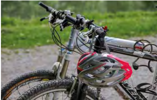
Wer sein Fahrrad auf der Anhängerkupplung seines Autos transportieren will, sollte deren Eignung überprüfen.