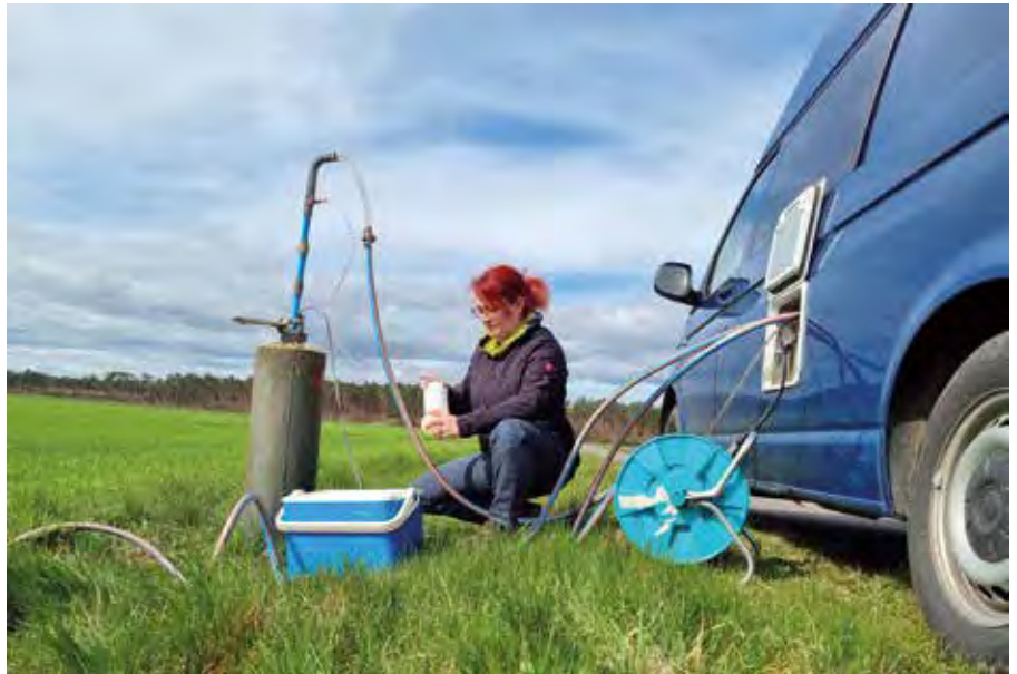
Unter anderem werden in dem FÖJ Techniken zur Grundwasserprobenahme vermittelt.

wochen (durchgeführt durch die LaNU), in welchem du dein Wissen in Umwelt, Natur und Nachhaltigkeit erweitern und dich mit anderen Freiwilligen und Pädagogen treffen und austauschen kannst.