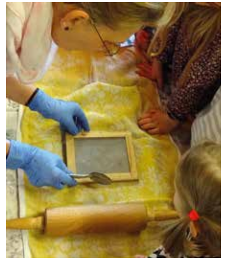
Aus Altpapier wurde neues Papier geschöpft.

Ein weiteres Highlight der Projektzeit war die Müllwanderung in Brandis. Die Kinder der Kinderstube sammelten Müll und wurden vor allem an Bushaltestellen und der Feuerwehr Brandis fündig. Ein Kind fand ein Stück einer Metallschaufel und hatte gleich die Idee dazu, dass sie auf dem Schrottplatz wiederverwendet werden könnte. Die Kinder entwickelten eine Vorstellung davon, wo welcher Müll hingehört. Auch bei uns zuhause lautet die Frage jetzt nicht mehr „Gelbe oder blaue Tonne?“, sondern „Plastik oder Papier?“. Au-