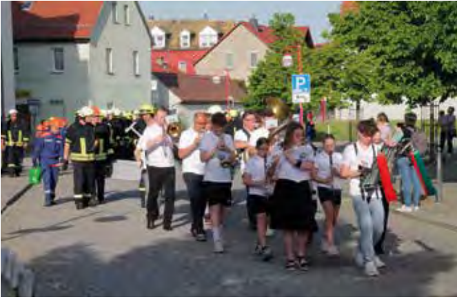
Angeführt vom Musikverein wurde der Maibaum auf den Markt getragen.