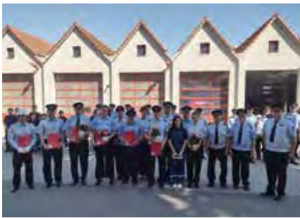
Alle am 1. Mai ausgezeichnete Kameraden.

Ausbildungsseitig lag der Schwerpunkt im letzten Monat auf Knotenkunde, Fenster- und Türöffnung, sowie dem Sägen von unter Spannungen stehenden Holzstämmen. Weiterhin beendeten wir einen 42-stündigen Truppführerlehrgang. An diesem nahmen 12 Kameraden aus Beucha, Brandis, Machern, Polenz und Püchau teil. In dem Lehrgang wurden sie befähigt, von einer normalen Einsatzkraft zum Führen eines Trupps zu werden. Dafür wurde das gesamte Einsatzspektrum aus der neuen Führungsperspektive gelehrt, wobei wir sehr viel Wert auf die praktische Ausbildung legten. Damit stehen unserer Stadt jetzt neun neue Truppführer im Einsatzdienst zur Verfügung.