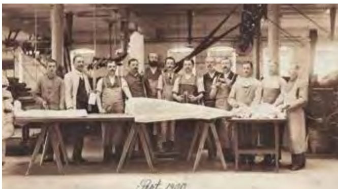
J. D. Weickert Filzfabrik Wurzen, September 1900

Der Eintritt ist frei. Für leibliches Wohl wird bei Kaffee, Kuchen und Roster von 10 bis 18 Uhr auch gesorgt sein!